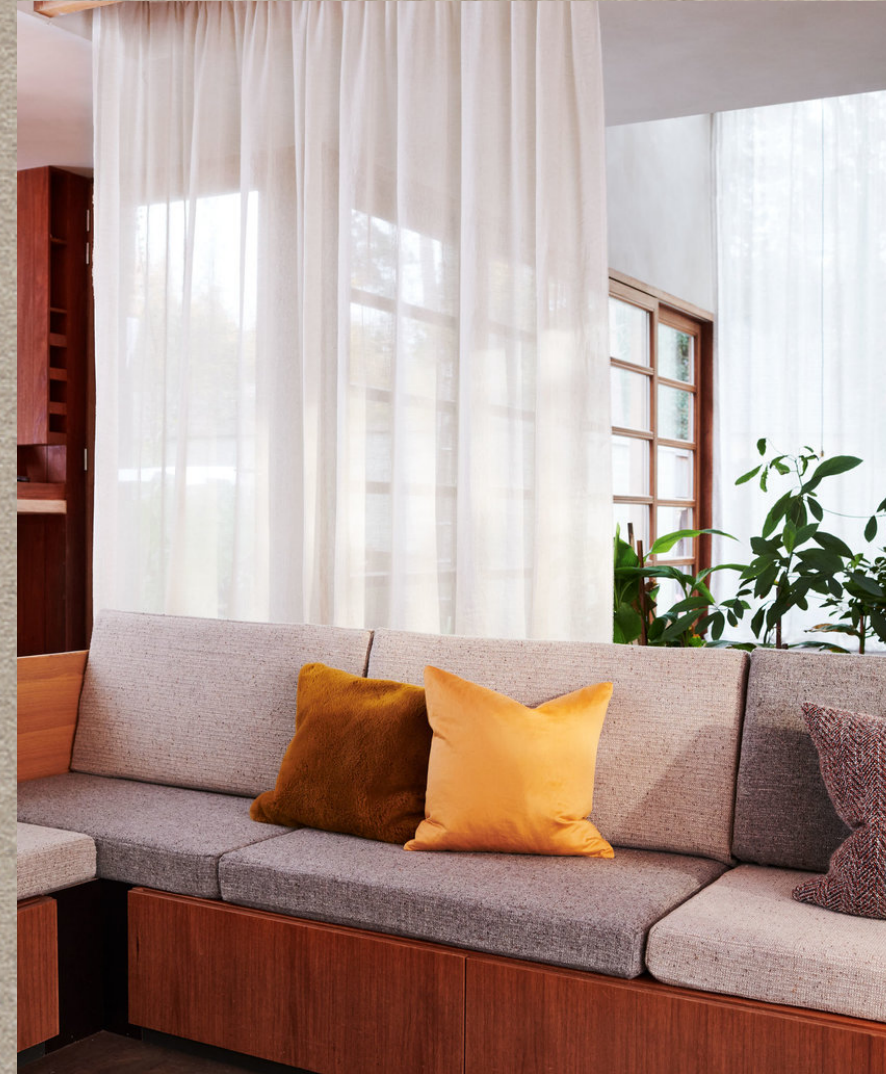
KUNA; AYNI; MILMA