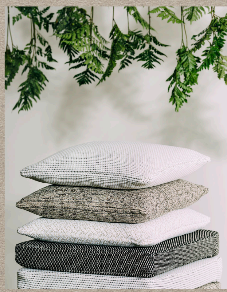
PARINGA; URUNGA; BINDIRIN