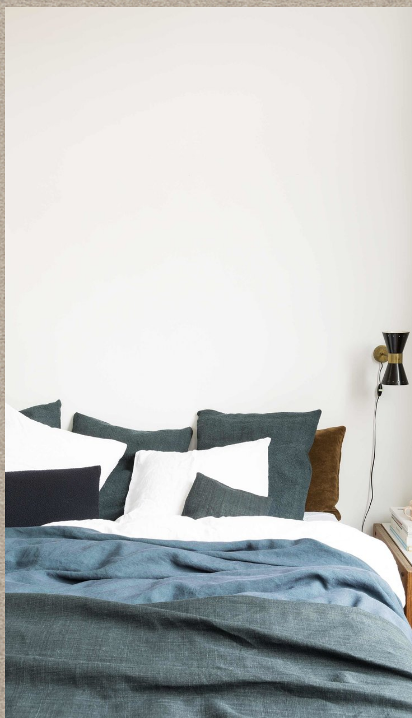
CANOA; MASKA; MALA