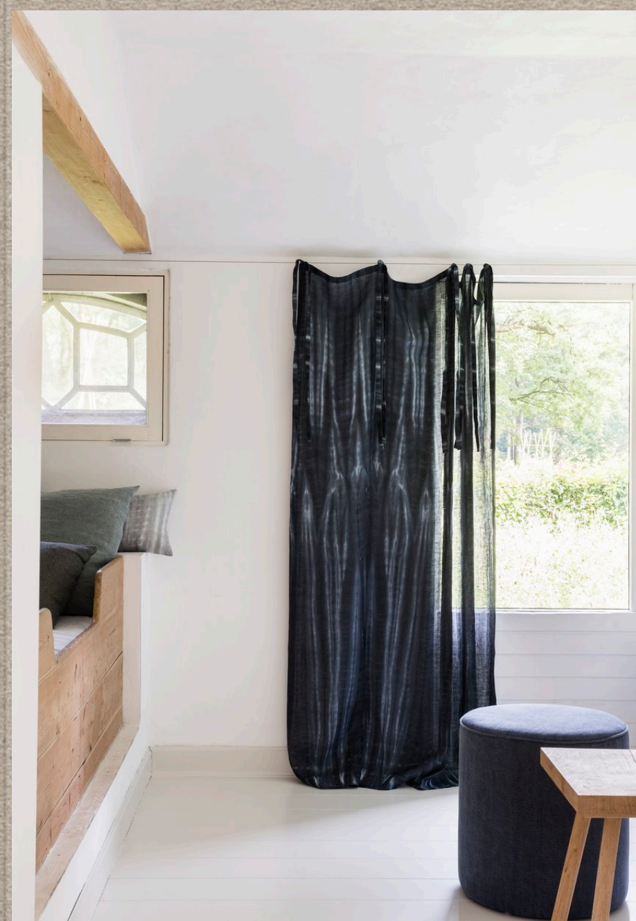
CANOA; YAMKA; MANIPI

Мягкие натуральные ткани коллекции NATIVE наполнены множеством деталей и передают ощущение приятной чистоты. Красота материалов, из которых они произведены - безупречна. Эта коллекция создана с использованием кустарных техник, передающих старинные традиции, тонкую ручную работу и адаптированных для современного стиля.