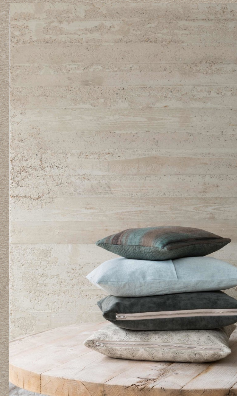
ACARAHO; HALIAN; NUBES; ATACAMA