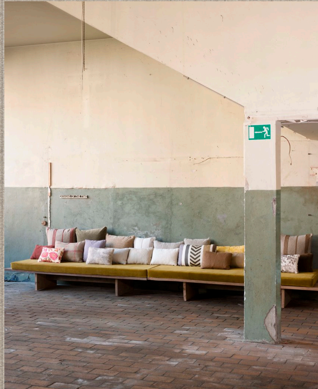
GATSBY; TAKA; TAKVOR; SPARTE; ATAR; KUITO

Все дело в джинсах и ботинках. Синяя джинса и оттенки кожи в этой коллекции гармонируют с многообразием ярких цветов необработанного льна и создают «casual» повседневный интерьер.