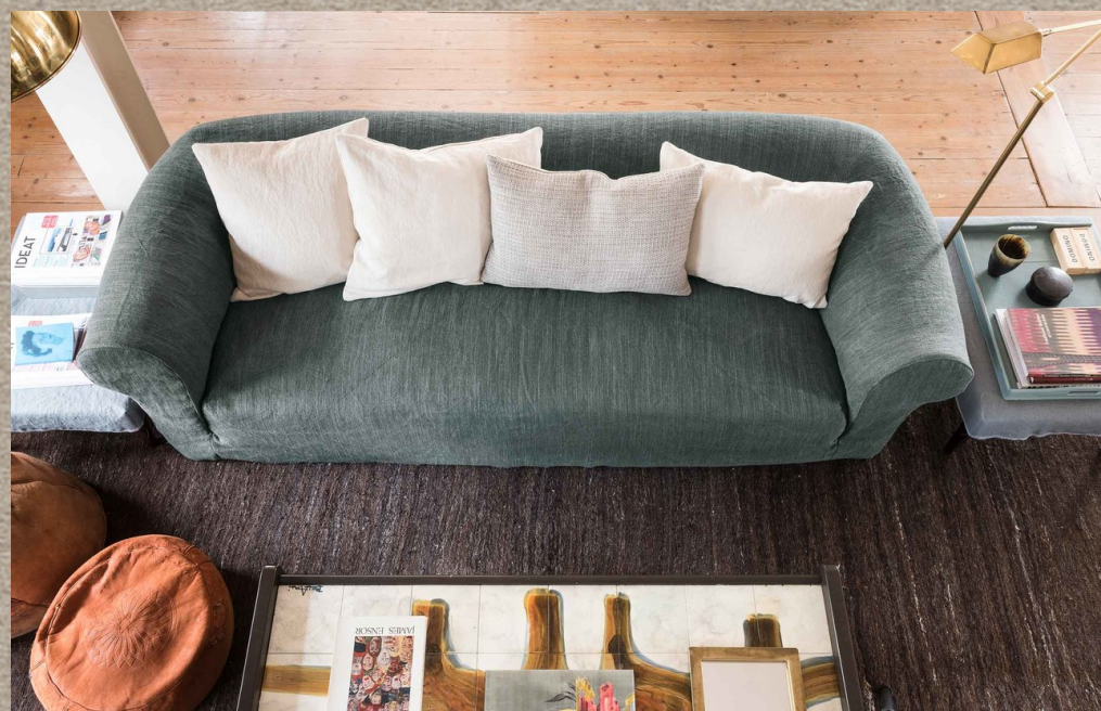
FARRAR; GOWAN; COBERLY