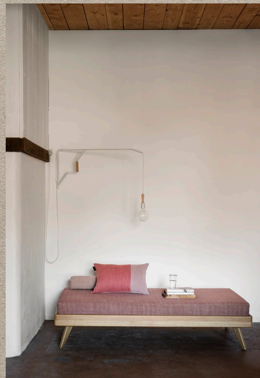
MASKA; PACO; CANOA