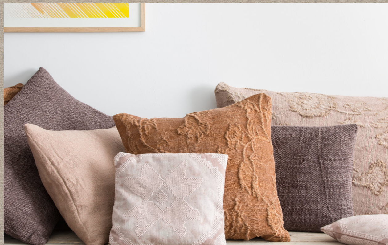
YAS; MISU; HALIAN