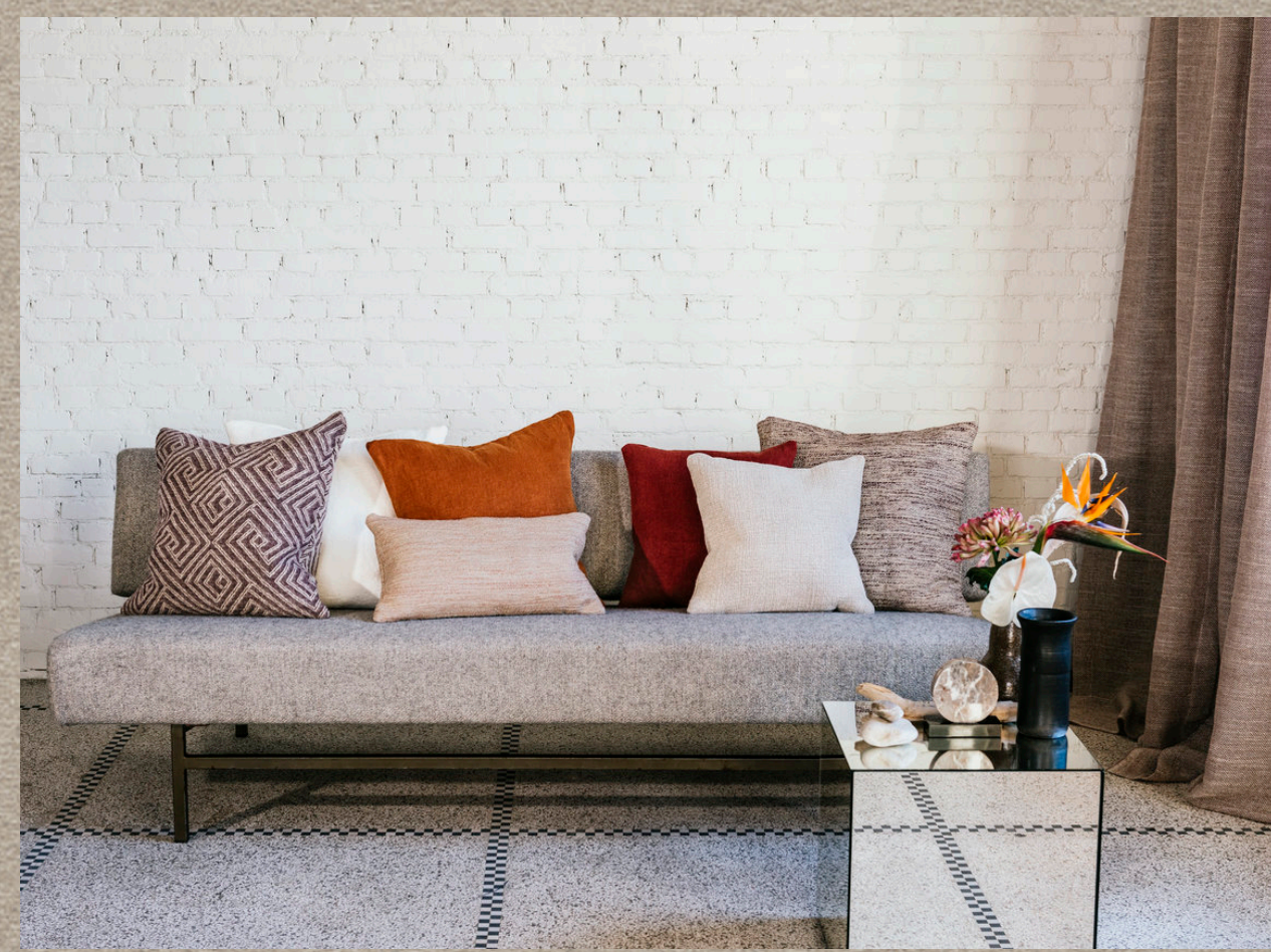
ANGONA; KINTORE; MOYHU; DAKU; INALA; BUNGOBITTAH