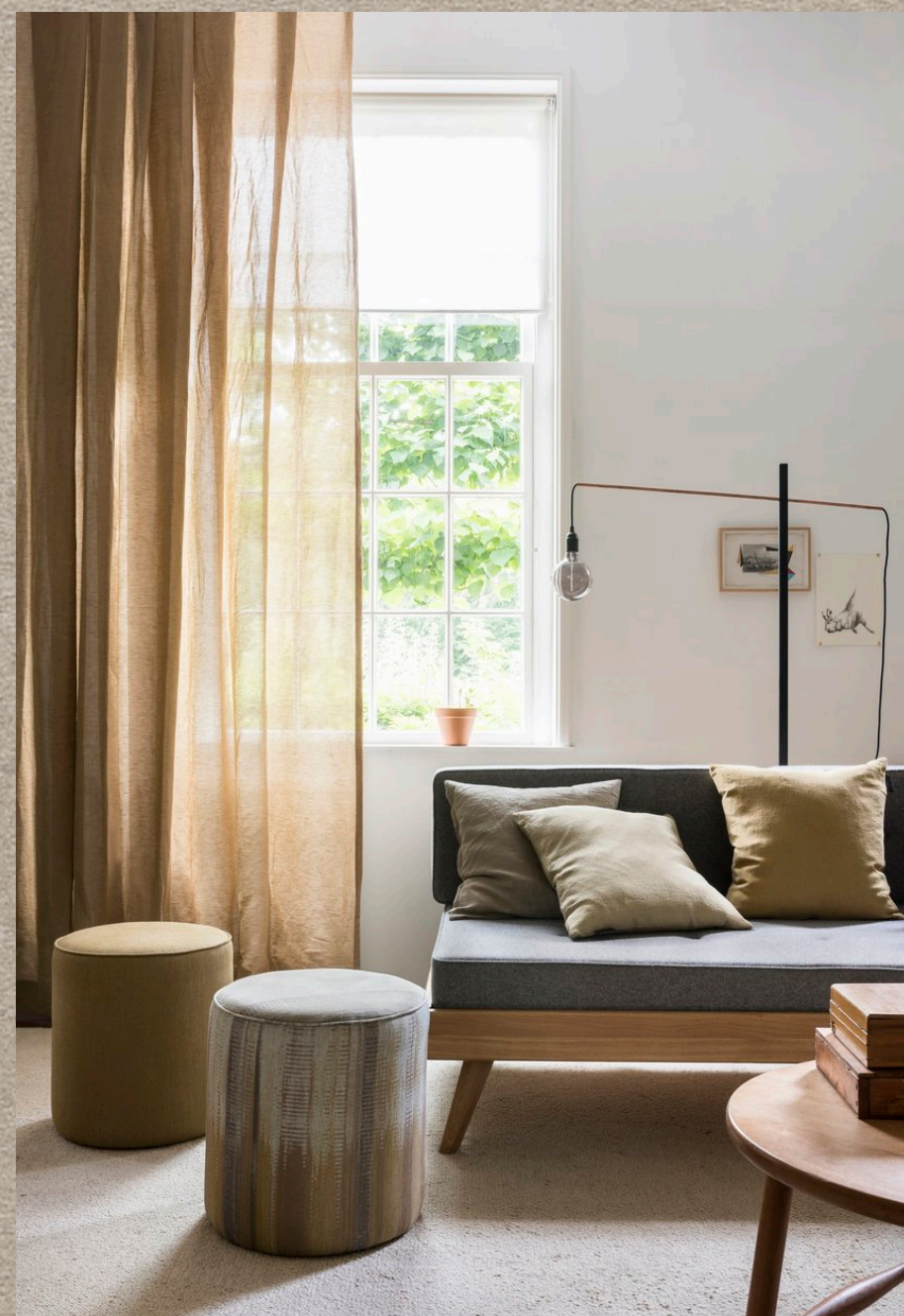
ACARAHO; TALISA; MOKI