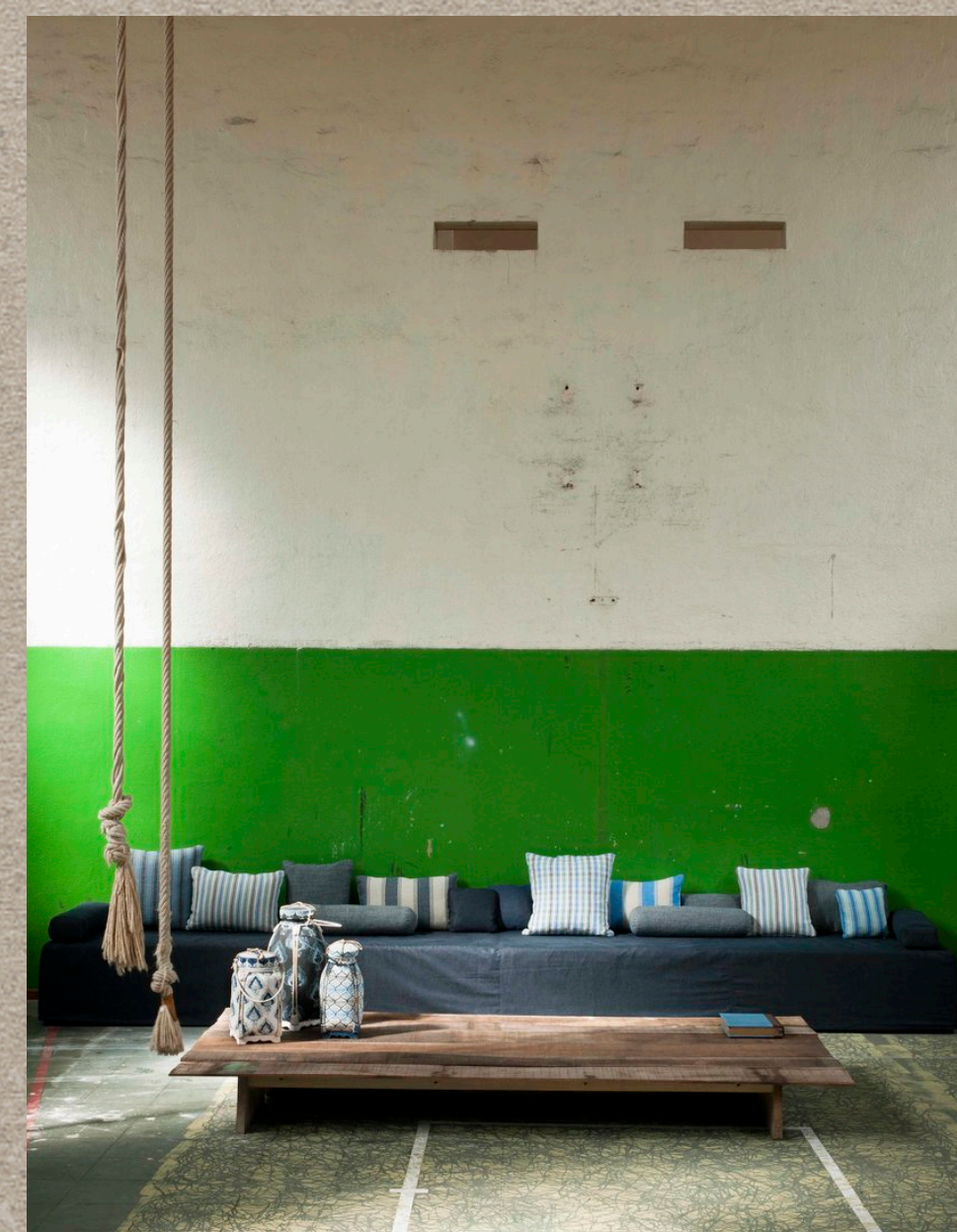
KEP; KALMI; KHUM; JUVAL