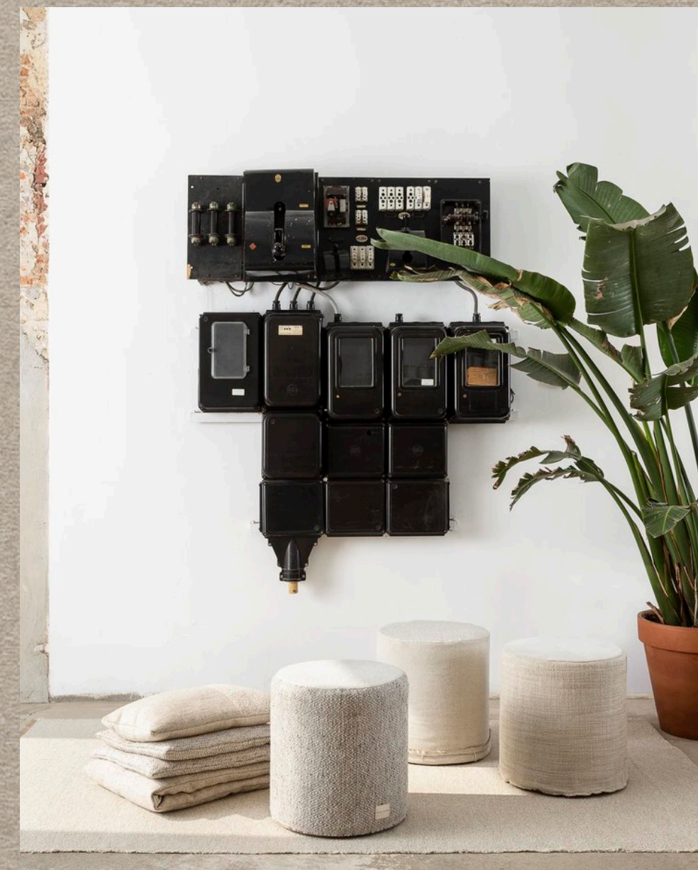
SONINKA; MANIACU; NUPE; EDO