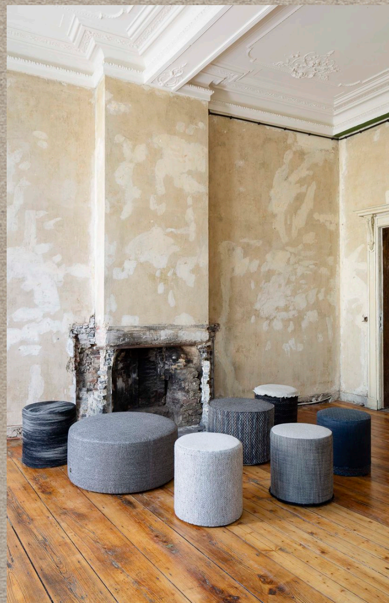
KAASA; TONKA; RATAYA; BOGOLAN

Коллекция 2018 года NOBLE SAVAGE передает минималистскую атмосферу искусства Африканских племен. Черные и белые, туманно-серые, оттенки темно-синих, размытые и живые цвета коллекции оживят каждый интерьер. Натуральный лен, как матовый, так и с блеском вносит свой вклад в неповторимый характер этой коллекции. Ее дизайны изящные и минималистичные. Неповторимая красота NOBLE SAVAGE плавно интегрируется в любой стиль.