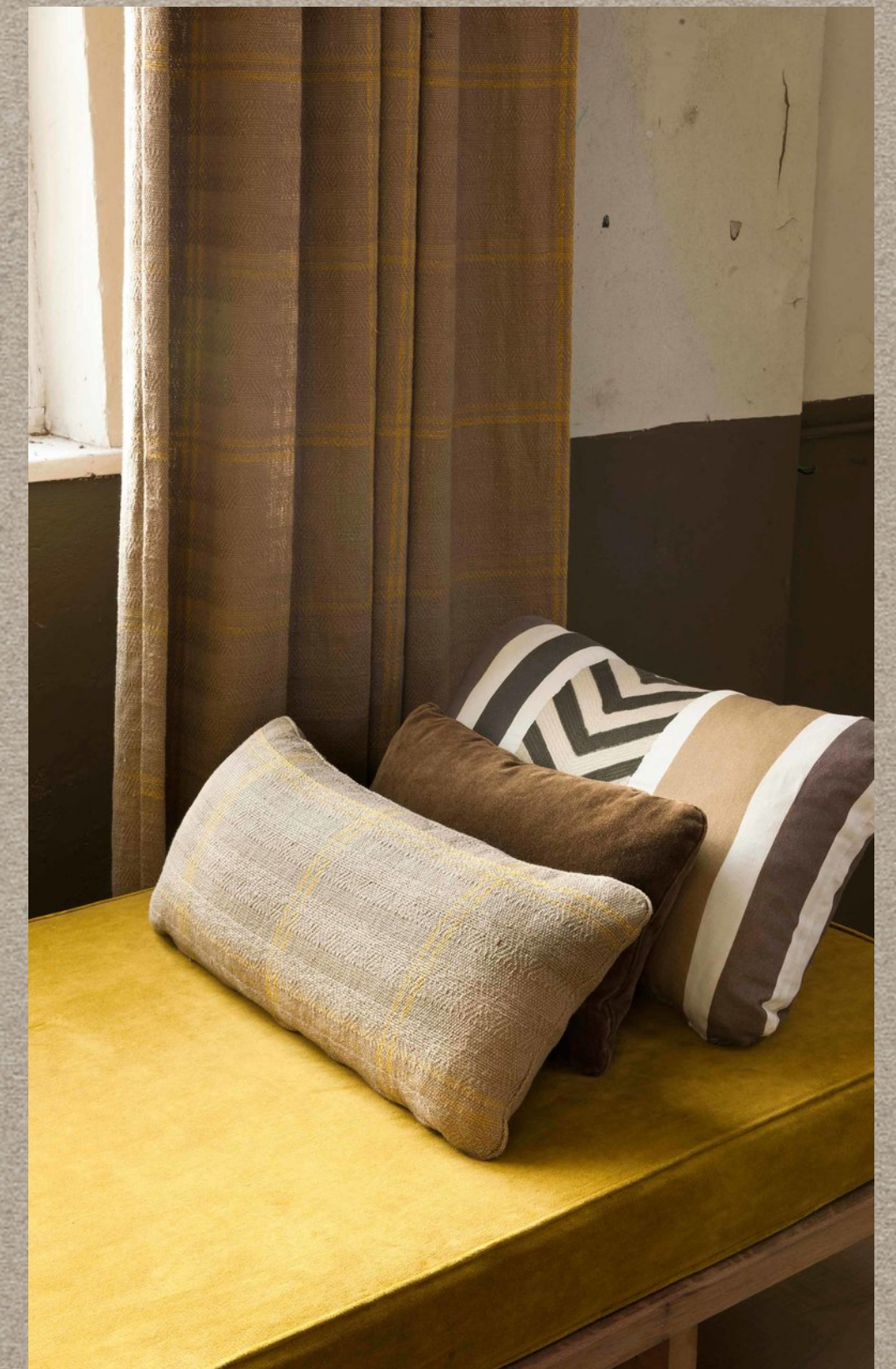
WAKAMBA; NUBES; ATAR