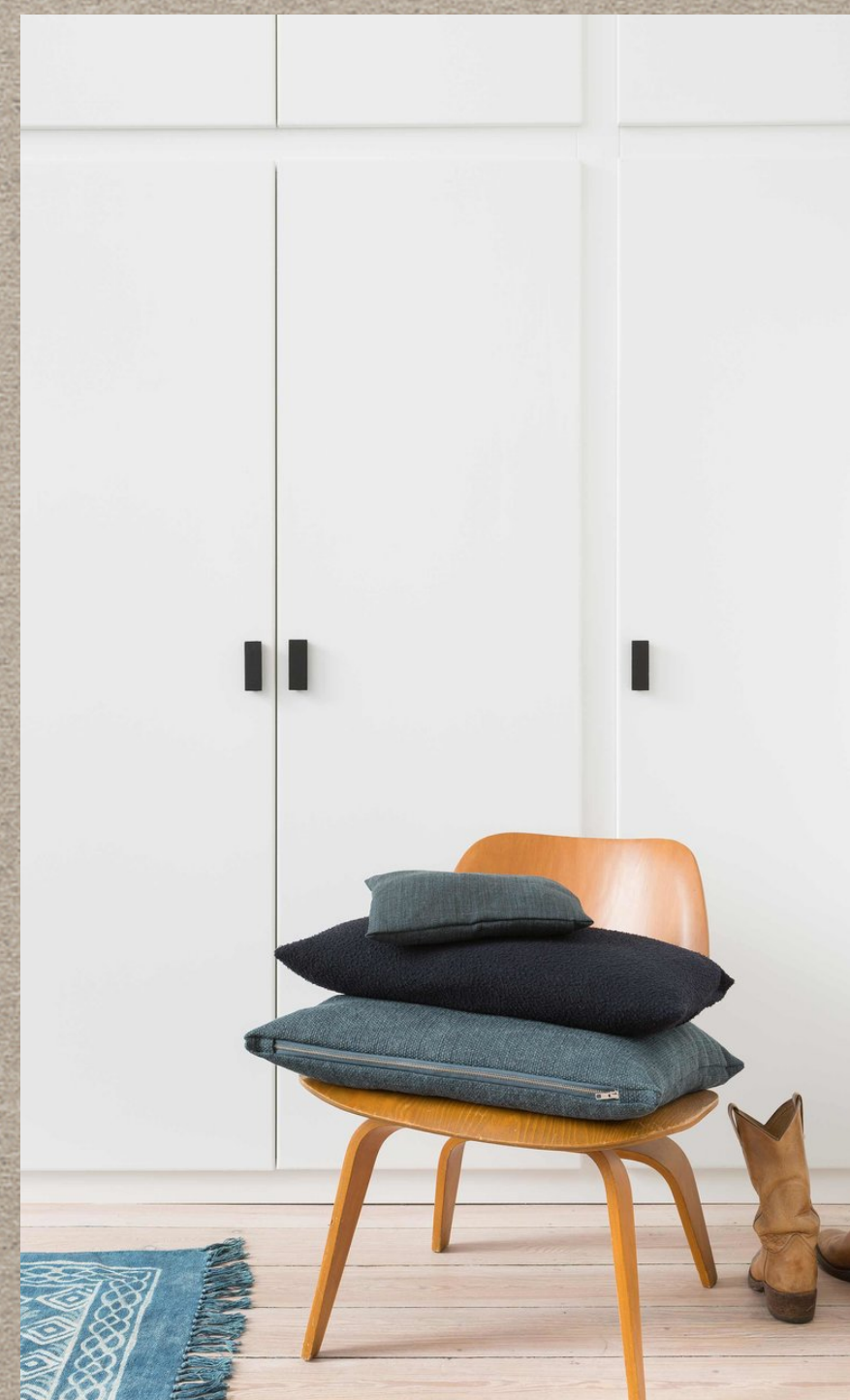
DJANGO; MASKA; CANOA