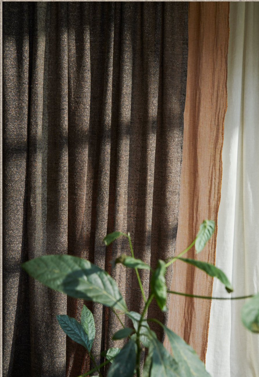
ARIMA; GUARANI; INTI