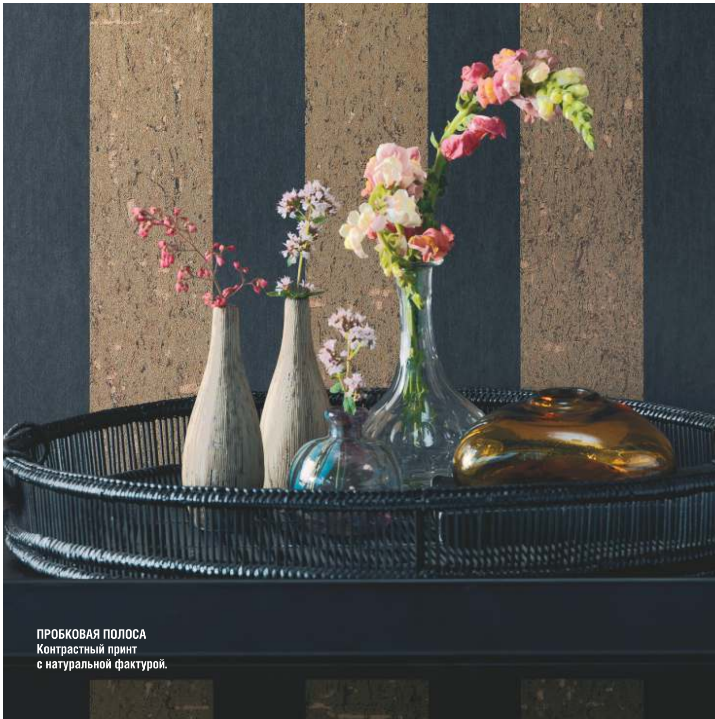
ПРОБКОВАЯ ПОЛОСА Контрастный принт с натуральной фактурой.