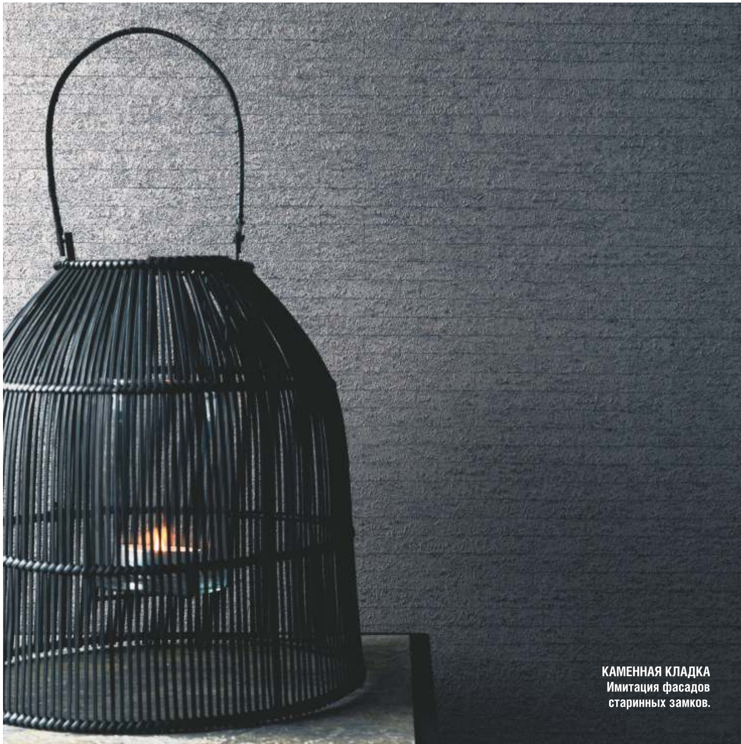
КАМЕННАЯ КЛАДКА Имитация фасадов старинных замков.